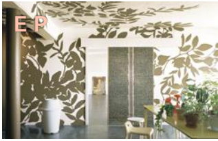
フラットでなめらかな塗材